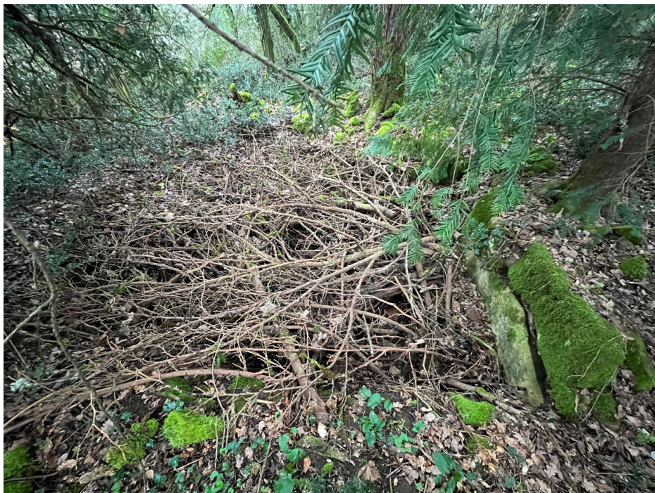
un exemple de cache

Au cours des sombres années de l'Occupation, La Roque-Gageac, un havre de paix dans la vallée de la Dordogne, a été le théâtre d'une résistance clandestine héroïque. Les habitants de cette petite commune ont écrit une page méconnue de l'histoire de la résistance française en cachant astucieusement des armes au cœur d'une forêt dense, utilisant des puits creusés comme arsenaux dissimulés.