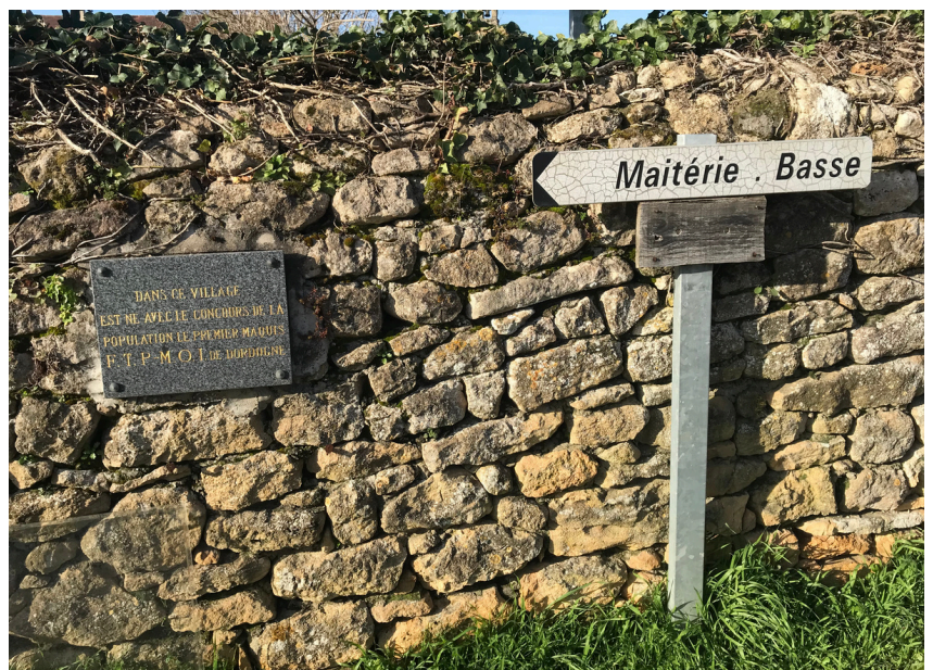
PLAQUE À L'ENTRÉE "DANS CE VILLAGE EST NÉ AVEC LE CONCOURS DE LA POPULATION LE PREMIER MAQUIS FTP - MOI DE DORDOGNE"

Notes historiques complémentaires : Dans le Sud Ouest , la forte participation de républicains espagnols à la Résistance s'explique pour des raisons historiques et géographiques évidentes . Après la victoire de Franco , ils ont passé la frontière par milliers . Ils avaient la haine du fascisme et du nazisme et se rappelaient que des Français étaient venus combattre dans les brigades internationales . souvent , ils ont combattu sous la bannière FTP - MOI ( Francs Tireurs Partisans - Main d'Oeuvre Immigrée ) . Ils étaient déjà entraînés au combat par la guerre civile en Espagne . A proximité , à Montignac et Fanlac , étaient formés des cadres de la Résistance au maniement des armes , des explosifs.